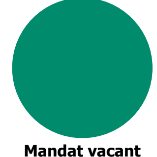
Mandat vacant Végétalisation du bâti et Paysage d'Intérieur