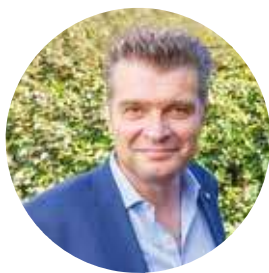
Laurent Bizot, Président de l'Union Nationale des Entreprises du Paysage