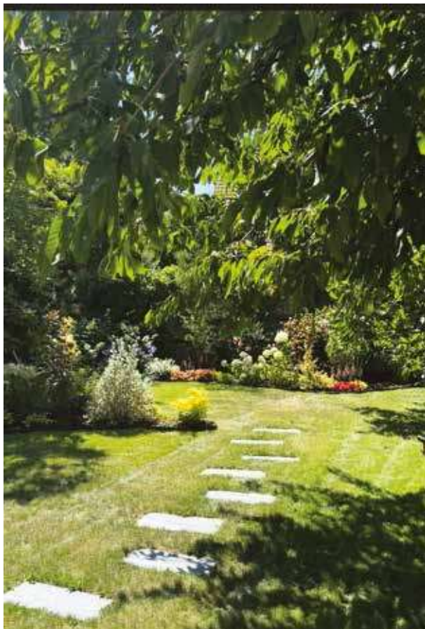
Création de jardins chez des particuliers