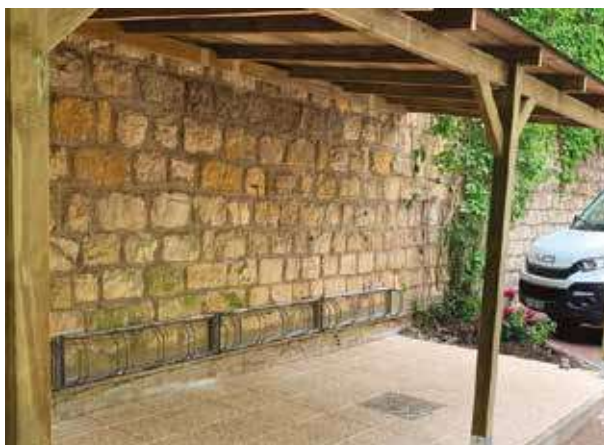
Création d'un hangar à vélo