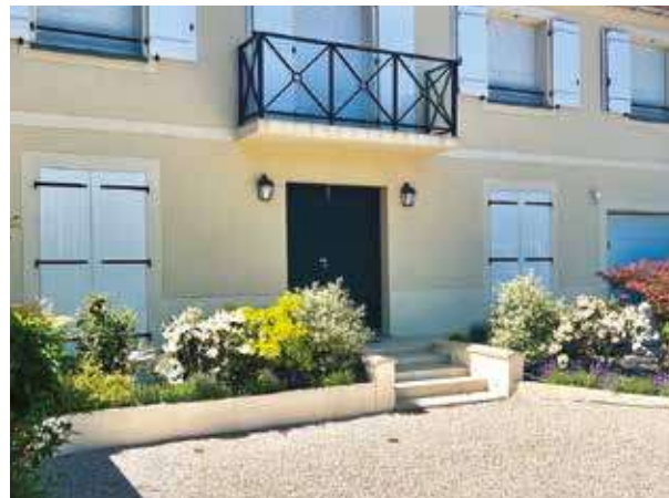
Aménagement d'une entrée de maison