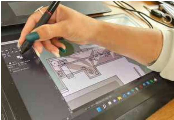
La conception de jardin passe par l'infographie