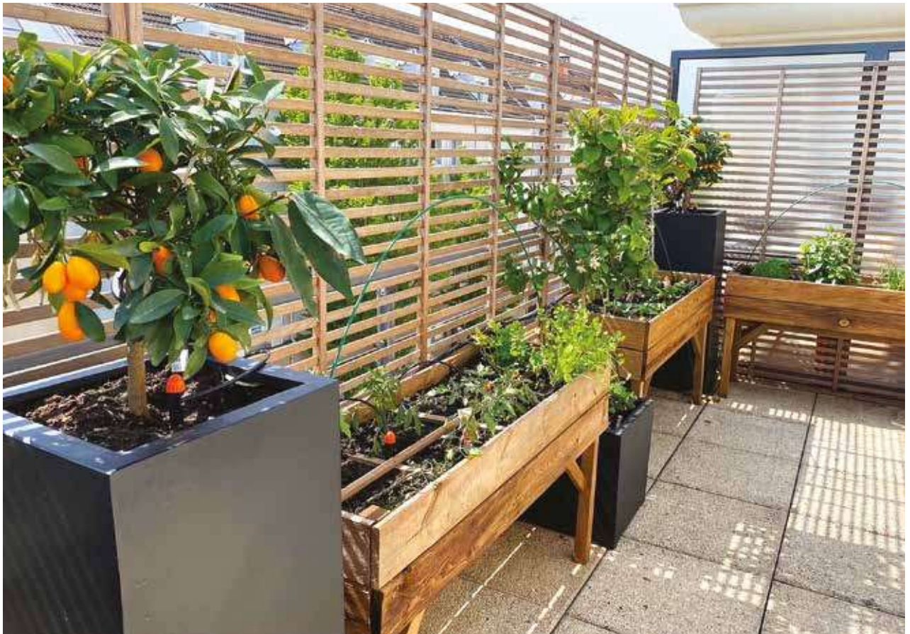
Aménagement de terrasse avec bacs potagers