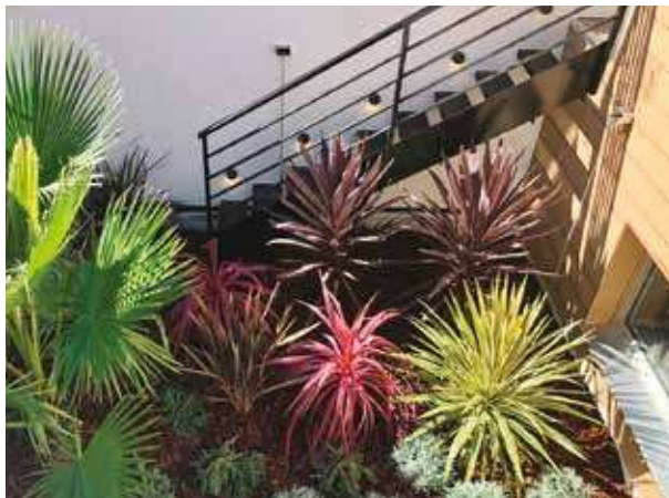
Création d'un jardin en cour anglaise