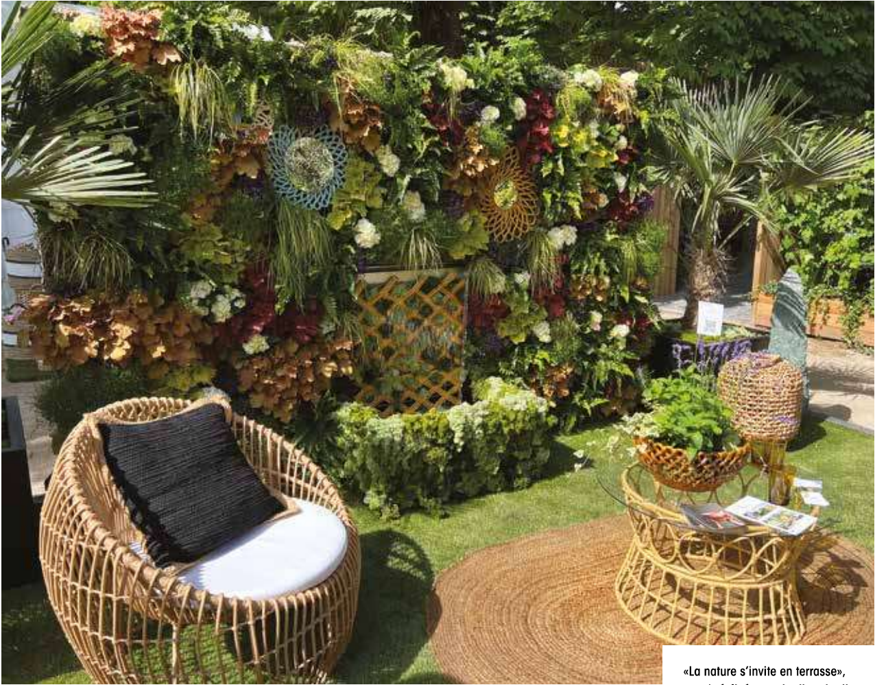
«La nature s'invite en terrasse», stand réalisé pour Jardins, Jardin par Lorge Paysages en partenariat avec Athezza et Maison Pichon Uzès