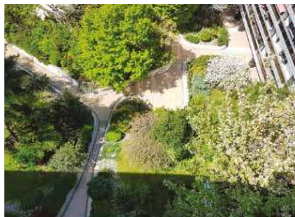
Entretien d'un grand jardin de résidence