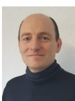
Xavier POILLOT Communication