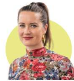
Commission Economique Charlotte Carla