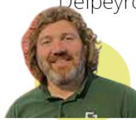
EPL Fonlabour 81 - CA Romain Navarro Fieffe