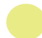
LPA Moissac 82 Jérôme Dalpozo