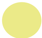
Rivesaltes 66 Ludovic Orain Pierre Giraud