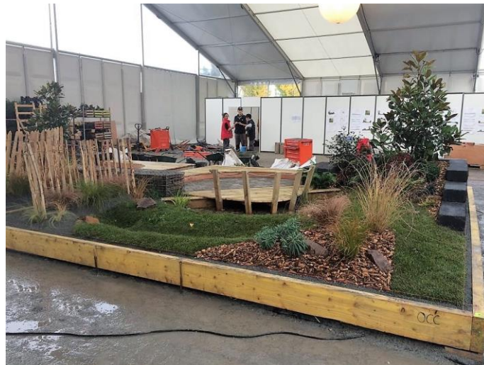
Le jardin présenté par les médaillés d'or de la finale des Olympiades des Métiers